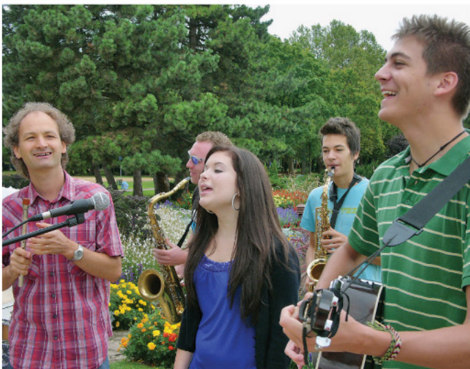
A film szereplői is zalai fiatalok.