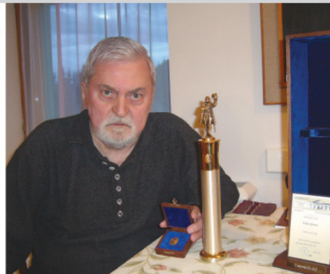
A 69 éves korában elhunyt Kossuth-díjas költőt szeptember 7-én helyezték örök nyugalomra Récicsen.

Pedig milyen szépen indult mindn. Fiatal bölcsészhallgatóként az 1960-as évek vé-