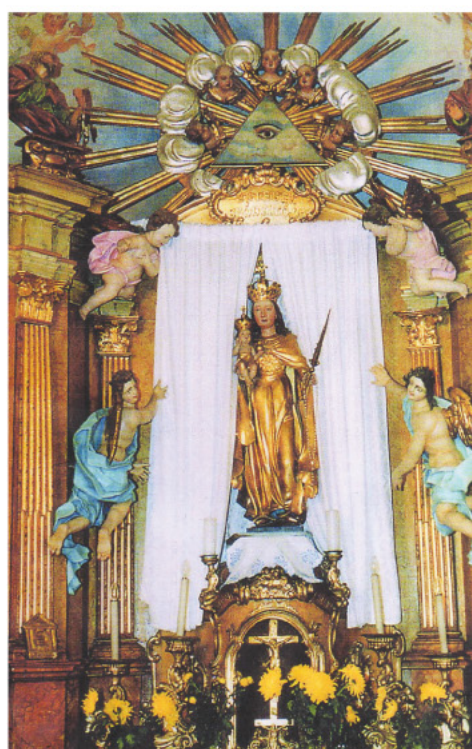
A román kori kápolna főoltára a kegy-szoborral.

Ma már nem raboskodnak külföldön, de számos lelki rabság uralkodik rajtunk, s a lélek béklyóinak lerázásához is szükségünk van Fogyó kiváltó Boldogasszony kiáradó kegyelmére.