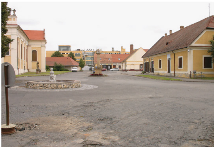
A tér valóban megérett a felújításra.

túl az árusítóhelyek alapterület-megjelölésével, valamint új raktárpavilon és szociális blokk létesítésével korszerűsödik.