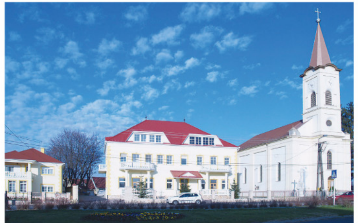
Pacsa a megye legfiatalabb városa.