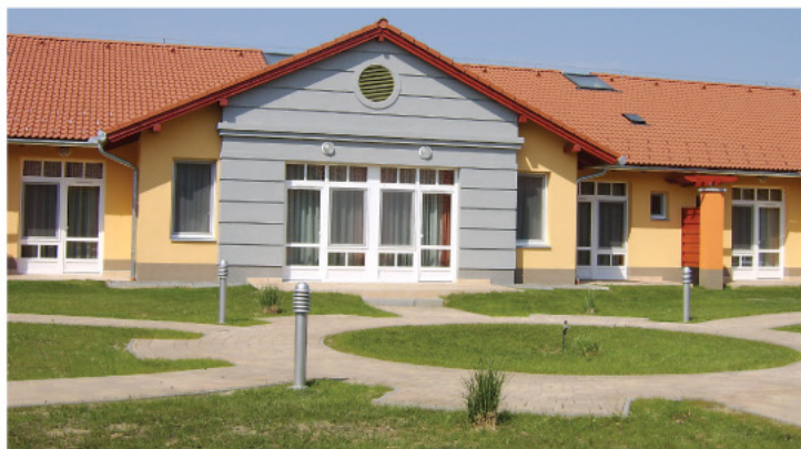
Idősek otthona épült Sármelléken is.

– Remélem, a megye polgárai látják, hogy érdemes a Fidesz-KDNP jelöltjeire szavazni az önkormányzatokban, hiszen már bizonyítottuk, hogy igenis képviseljük a megye településeinek érdekeit, tudunk és akarunk együtt dolgozni. Tiszteljük a független jelölteket, közülük sokat támogatunk is, de tudni kell, hogy a magát függetlennek feltüntető sem mindig garancia. Érdemes most is a többségre szavazni, hiszen a nagyobb többség határozottabb cselekvést tesz lehetővé, ahogy azt a parlamenti munkában is most láthatjuk.