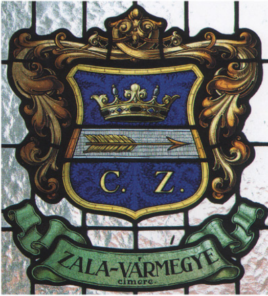
Zala megye címere a zalaegerszegi református templom ablakán.

Bél Mátyás, a magyar földrajz- és történettudomány egyik klasszikusa jegyezte fel 1740 körül, hogy Zala vármegye címere „nagy egyszerűséget mutat, s ez [...] annak a bizonyítéka, hogy igen régi eredetűnek kell lennie”. Valóban, megyénk címere egyike Magyarország legrégebbi önkormányzati jelképeinek. Zala vármegye 1550-ben elsők között kért és kapott királyi címeradományt. Az erről szóló oklevél ugyan nem maradt fenn, ám ismerjük az ekkor vésetett címeres pecsétnyomó lenyomatát, melyen latinul e körirat olvasható: „Zala megye pecsétje 1550”. A pecséten az alábbi címer látható: kerek talpú, kétoldalt szimmetrikusan ívelt tárcsapajzs, melyet az alsó harmadában pólya (vízszintes sáv) oszt ketté. A pólya felett falombot formázó ötágú, nyílt korona lebeg, a pólya alatt pedig a „ZALA” szó, a megyét kettőszelő, névadójául szolgáló folyó neve olvasható. Az első pecsétnyomó a háborús időkben gyorsan elkalódhatott, mert megyénk 1559-től már egy másik, az előzővel alapvetően megegyező, ám a leveles koronát felismerhetőben ábrázoló pecsétet használt. E pecsétnyomót az 1600-as évek elejétől egy harmadik váltotta fel, amelyet azután folyamatosan használtak a 17., és vélhetőleg a 18. században is, egészen 1786-ig. A harmadik pecsétváltozat pajzsán már nem szerepelt a „Zala” felirat, köriratából kimaradt