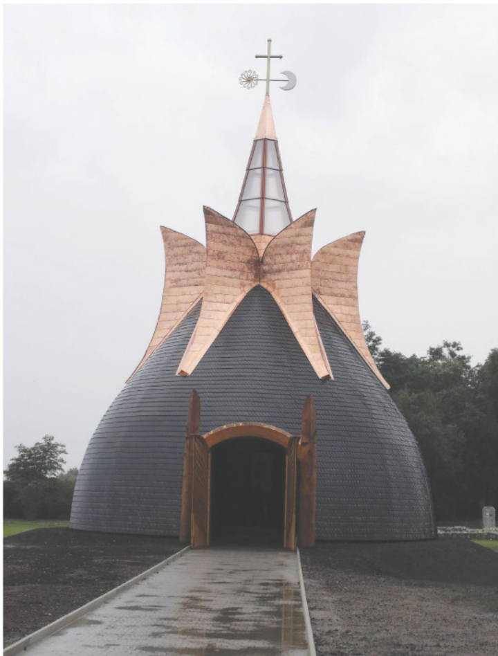
Méltón őrzi az 1000 éves Zala megye emlékét.

Az ezer éves Zala megyét – akkori nevén Kolon – egy 1009-ben, Solyban keletkezett, Szent