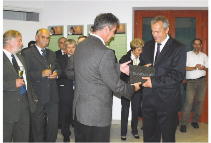
A Kis-Balaton is Zala megye 7 természeti csodája közé került.