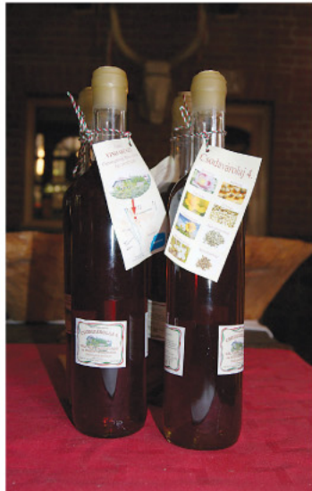
Hűvös sajtolással készült olajak.

A Várszínház Magyarország első, s egyetlen színházi céllal épült vára. Színpadán sokan megfordultak már, de a nagy átörös még várat magára. Kulturális programok, bemutatók ma is vonzzák a környékbeliakat. A tulajdonos rövidesen ide várja a Tomaj nevű települések képviselőit, a kunok (!) ivadékait is.