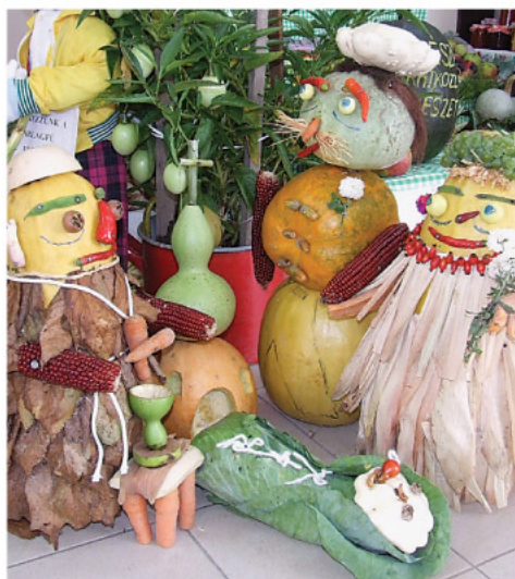
A nagykutasai népdalkör zöldségszobrai.