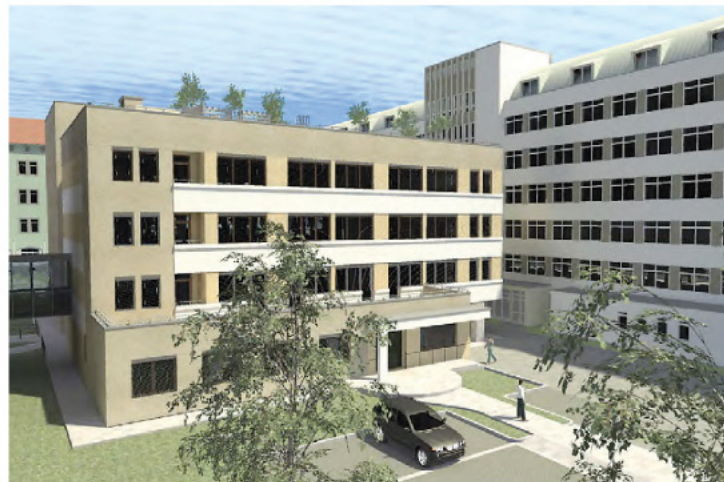
Csaknem ötmilliárdos fejlesztés kezdődik a Zala Megyei Kórházban. A bővítés egyik látványterve.

– Hamarosan új összetételű megyei önkormányzat vezet Zala