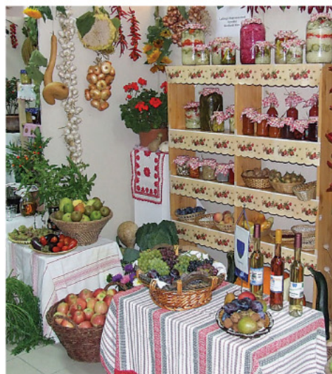
A lakhegyi hagyományörzők kiállítása.

Szeptember második hétvégéjén ismét megrendezésre került a kertbarát körök megyei terménybemutató kiállítása, amelynek az előző két évhez hasonlóan Lakhegy adott otthont. A zsűri idén is két kategóriában hirdetett győztest.