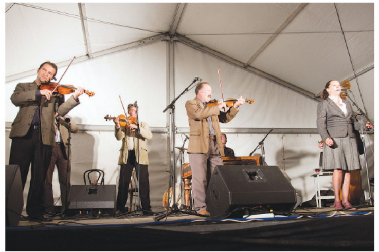
Este a Csík zenekar adott koncertet.