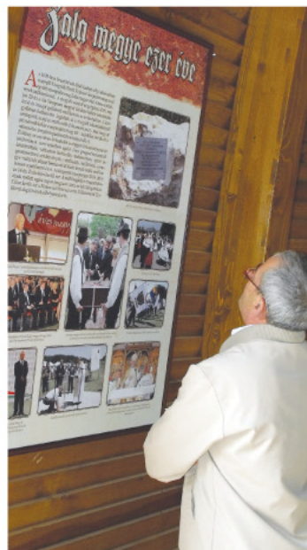
Történelmi kiállítás gazdagította a programot.

A zalavári emlékmű a megyei önkormányzat és a települések adományaiból jött létre. A jövőben egy életfát is elhelyeznek az épületben, melynek levelei egy-egy települést jelképeznek majd. Az emlékműben a későbbiek során