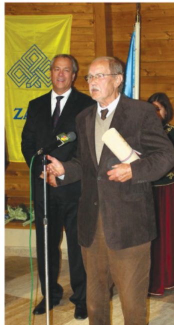
Makovecz Imre ezen a napon vehette át a Zala Megye Díszpolgára címet.

– Ritka amikor a megye és az állam egyensúlyban van. Most hónapokkal ezelőtt egy kedvező folyamat indult el. Az államunk még csak tekintélyében erős, bizalmat kell neki szavaznunk, hogy megerősödhessen. Ismét lehetőségünk van építeni az országot, melyhez folytonosságot sugárzó, jól működő önkor-