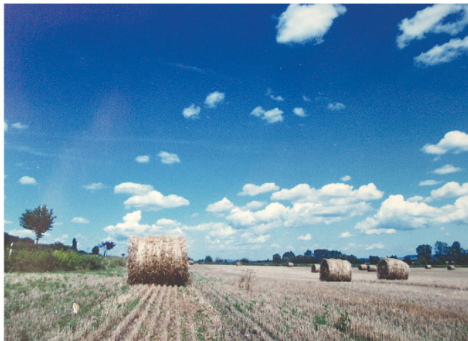
A magyar termőföld ára jóval alatta van az uniós átlagnak.

2011-ben lejár hazánkban a földmoratórium, azaz a külföldiek földvásárlási tilalma. Ezután bárki eladhatja birtokait külföldieknek. A magyar gazdák és az ország érdeke az lenne, hogy a moratóriumot meghosszabbítsák, ehhez azonban az EU hozzájárulása is szükséges, ami egyelőre kérdéses. A magyar termőföld ára jóval alatta van az uniós szintnek, így megéri a külföldieknek itt befektetni. Segítséget jelentene, ha a magyar gazdák a magyar vásárlókat részesítenék előnyben.