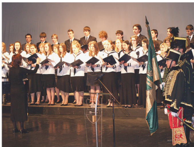
A zalaegerszegi Zrínyi-gimnázium kórusa.

Zala megye kosárlabda sportjának szervezésében és irányításában vég-