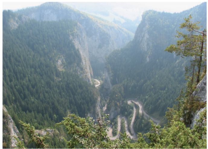
Hargita megye gyönyörű tájaival csábítja a turistákat. Látkép az Oltárkőről.