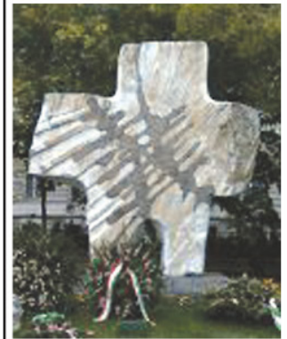
Az áldozatok emlékműve.

Országgyűlés 2000. június 13-án elfogadott határozata értelmében minden év február 25-én tartják a KOMMUNIZMUS ÁLDOZATAINAK EMLÉKNAPJÁT. 1947. február 25-én Kovács Bélát , a Független Kisgazdapárt főtitkárát a megszálló szovjet katonai hatóságok jogtalanul letartóztatták és a Szovjetunióba hurcolták, ahol nyolc évet töltött fogságban.