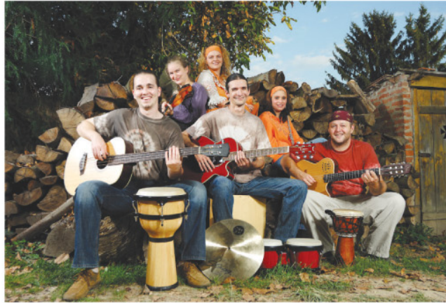
Maradandó élményeket adnak a gyermekeknek.

Előadásuk során számos kultúrkörből származó hangszerrel, köztük furulyával, fuvolával, töröksípval és dobval ismertetik meg a gyermekeket. Az együttes kiváló, sokéves múlttal rendelkező zenészei színe-