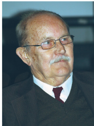
– Ez a Zala azt mondja, hogy az övé vagyok. Köszönöm.

Első figyelemreméltó munkájának a paksi templomot