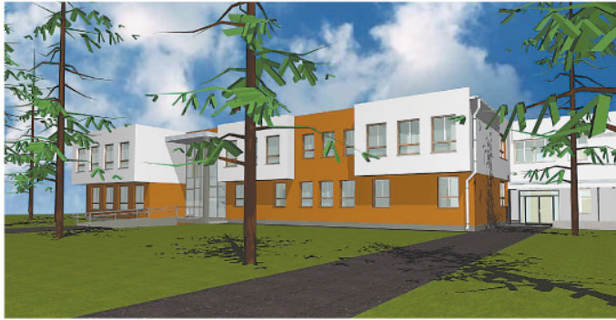
Megújul és bővül a szakellátó központ.

A századik magyar város, Zalaszentgrót és kistérsége hamarosan egy megújult és bővített járóbeteg szakellátó köz-