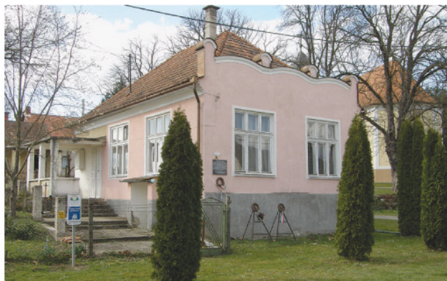
A pákai Öveges emlékház felújítását is támogatják.