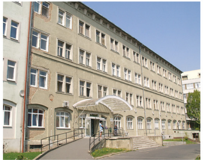
A szakmailag is elismert kardiológia méltó helyet kaphat.