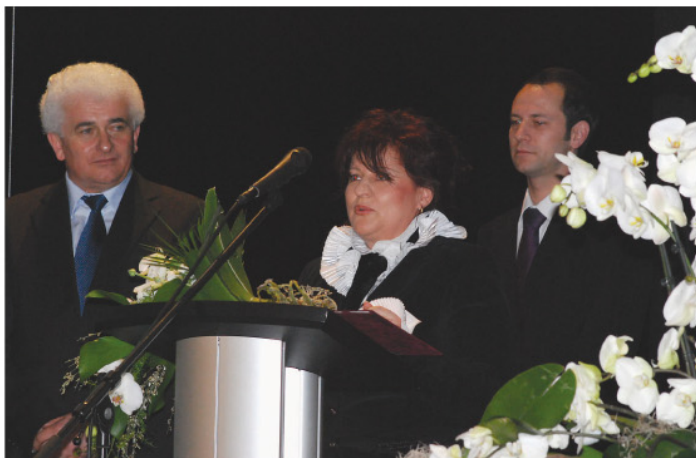
Sokat tett a muravidéki magyar kultúráért.