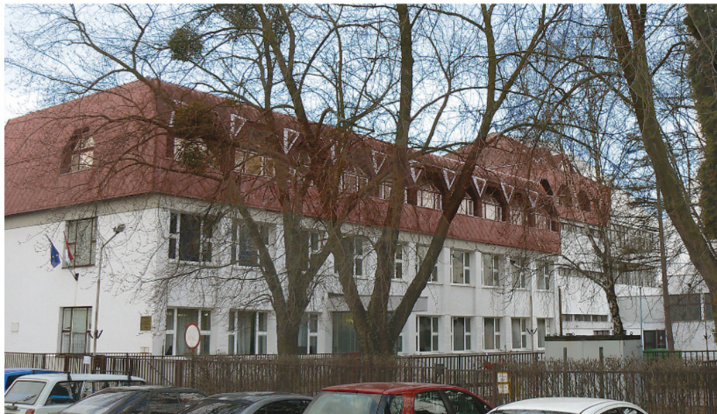
Keszthelyen iskolát neveztek el a tábornokról.