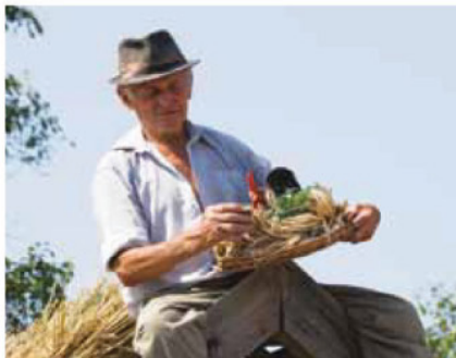
Zsúpkettőzés és zsúpolás a zalabaksai versenyen

A megyeszerte általános, „egyvégtében”, egyenes tetőgerinccel épült házakhoz képest a göcseji boronáépületek formagazdagsága nagyobb. A természet adta lehetőségek és a gazdálkodás különbözősége a zárt falusi utcák helyett kisebb épülecsoportokból álló falurészeket, úgynevezett szegeket hozott létre, amelyeket legtöbbször az ott lakó családról neveztek el (Barabásszeg, Pálfiszeg, Kustánszeg, stb.). E szegekben többféle ház- és