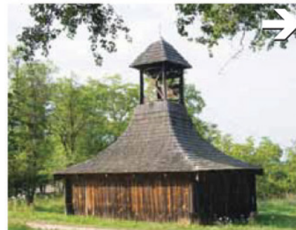
Szoknyás harangláb Felsőszenterzsébeten

telektípus alakult ki, négy oldalról kerített, zárt udvarú, vagy csak hajlított, széles utcai homlokzatú, előkamrás házak változatos képe fogadta az arra járókat. Szintén ezen a vidéken terjedt el a kástu, ez az emeletes gerendaépület, mely kamraként és pinceként is szolgált: élelmiszert, bort, szerszámokat tároltak benne. Kőházak Zalában csak a Balaton közvetlen környékén épültek.