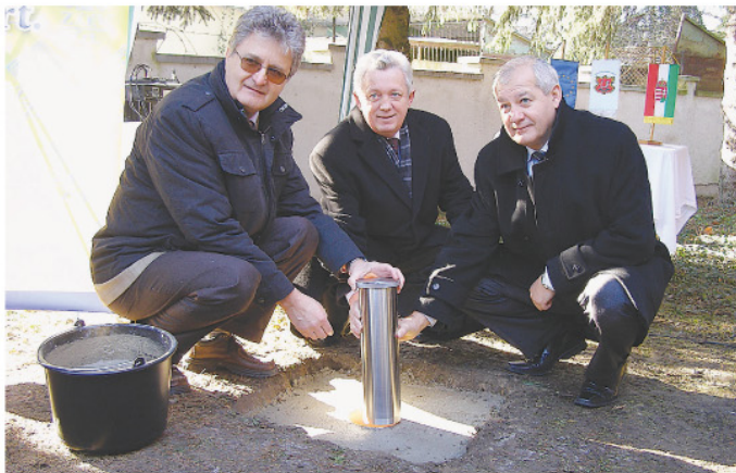
Az ünnepélyes alapkövetétel.

ponttal gazdagodik. Az Új Magyarország Fejlesztési Terv (ÚMFT) háromszáz millió forintos támogatásával 445 négy-