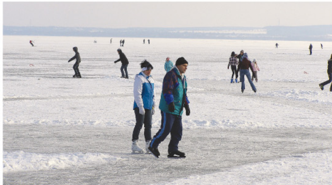
Korcsolyázók a keszthelyi Balaton-parton. Lassan itt a tél vége.

Február a rómaiaknál a legősibb időkből az utolsó hónap volt, záró napja pedig Terminus, tehát a végzés, a befejezés ünnepe. Ez magyarázza, hogy részben a halállal, részben a termékenységkel kapcsolatos kultúrák fűződnek ehhez az időszakhoz, és általában az engesztelés hónapjaként tartották számon az ókorban.