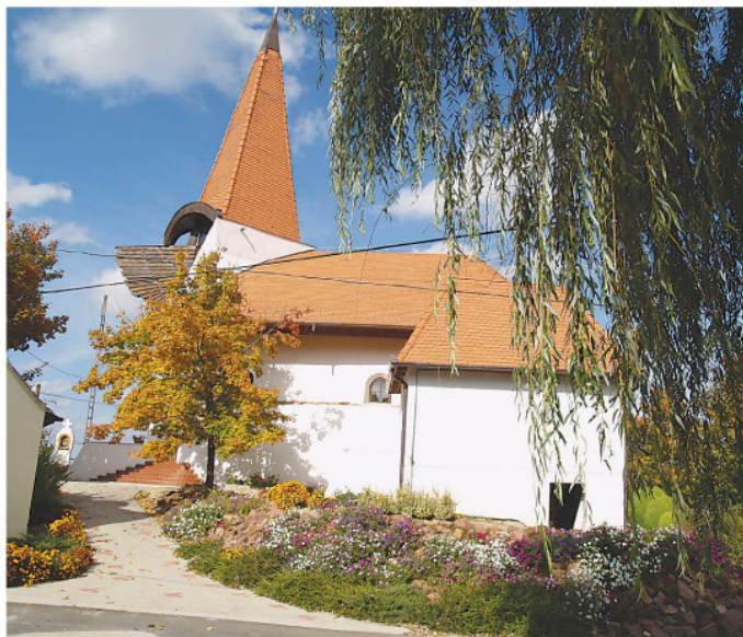
A pethőhenyei Szent István templom.

kációs tekintélyrombolás, mint mind elfogadott, legitim, szerves része annak a militáns antikul- túrának, mely az embernek azt sugallja, hogy az állatoktól szár- mazik, hogy biológiai egység-