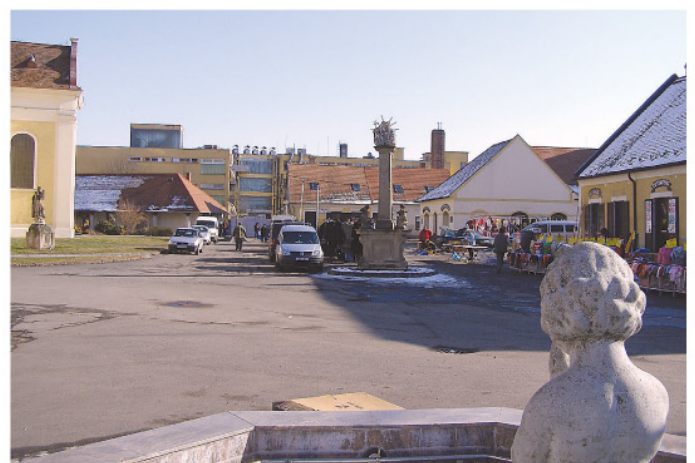
Október végére szinte minden megújul.

Ennek keretében városi rendezvény- és piacteret alakítanak ki, kitiltják a területről a járműforgalmat. Új világítást és burkolatot kap a templomtér (a csatornázást és a csapadékvíz