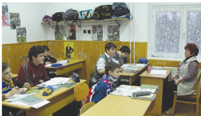
Délelőtt a tanulása a főszerep.