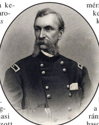
Asbóth Sándor tábornok.

A szabadságharc levereése után Kossuth tal együtt hagyta el az országot, s követte őt az emigráció állomásain. A kormányzó legszűkebb bizalmasi köréhez tartozott. 1851-ben New Yorkban telepedett le, ahol