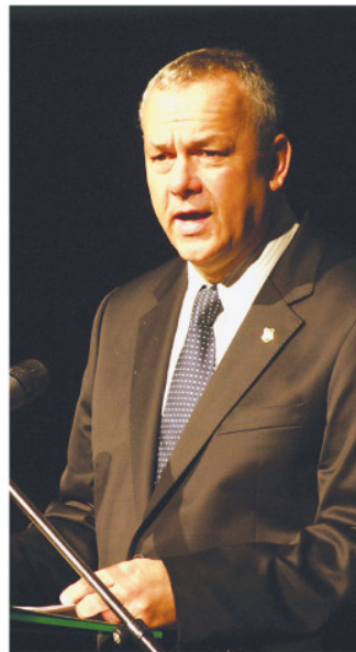
Manninger Jenő kihangsúlyozta a szülőföld szeretetét.

iratban a következőket olvashatjuk: „...a parlamenti kormány s felelős minisztérium mellett másik lényeges kelléke alkotmányunknak a megyék, kerületek és városok törvényes önkormányzata. E kettő válhatatlan kapcsolatban áll egymással...ez nyújt nyilvánossága által a visszaélések ellen legbiztosabb ellenőrséget, ez korlátozza a tisztviselői hatalom jogtalan túlterjeszkedését, alkotmányos életünk folytán ez óvta meg hazánkat a bürokratikus rendszertől.” A politikus Deák Ferenc szavaival élve arra hívta fel a figyelmet, hogy egykoron sem talált pártolásra és ma sem fogadhatjuk el az erőszakos régiósítást. A hagyományok, a kulturális-közjogi örökség ma, a globalizáció tájfunja közepette, még nagyobb érték, mint valaha. Az elmúlt években megerősödött identitásunk, tudományos műhelyekben dolgozzuk föl a múltat és értékeljük újra a történelem homályába merült és taszított eseményeit. A vidéki Magyarország ismét a megújulás tarsolya, bázisa, szellemi és emberi hátszaga lehet, amelyhez bátorság, vállalkozó kedv és szakértelem szükséges.