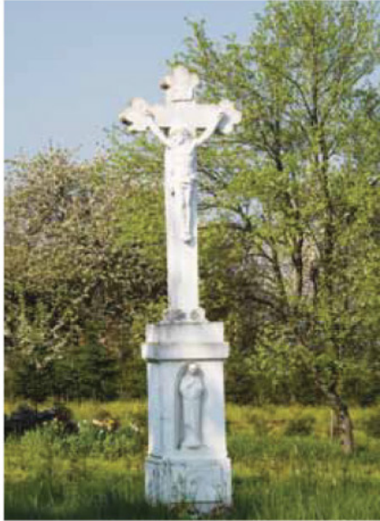
Útmenti kőkereszt, Liszó

gerendákból ácsolt és faszindellyel fedett, „szoknyás” szerkezetűtől (Felsőszenterzsébeti harangláb) egészen az egyszerű, Y-alakúig, amelynek csak „sisakját” fedte zsindegy, sokféle nagyság és forma fordul elő falvainkban. Előbbi szinte jelképévé vált Göcsejnek, s mint ilyen jelenik meg a megyeszékhely – és egyben Göcsej „fővárosának” bevezető útjain ugyanúgy, mint a csengőkkel, festett bádogdíszekkel és -korpusszal ellátott, vagy faragott faszobrokkal felszerelt útmenti keresztek. Ezek végigkísérték a megyei utakat, sőt a mezei, vagy szőlőhegyi dűlőket is. Sokszor fogadalomból állították őket. A lakásbelsőik általában egyszerűek voltak. Különlegesebb bútorfajtákat, almáriumot, pohárszéket, ruhásszekrényt a 19. század közepéig inkább csak a kismemesi kúriákban használtak, ugyancsak oda kerültek a művebb kályhák is. A szegényebbek berendezéséhez a padok, ládák, tékák tartoztak, később a sublatos láda vagy komód. A korai darabok: asztalok, ágyak, ládák ácsolt technikával készültek, ezeket a 19. század derekán váltották föl a puhafából,