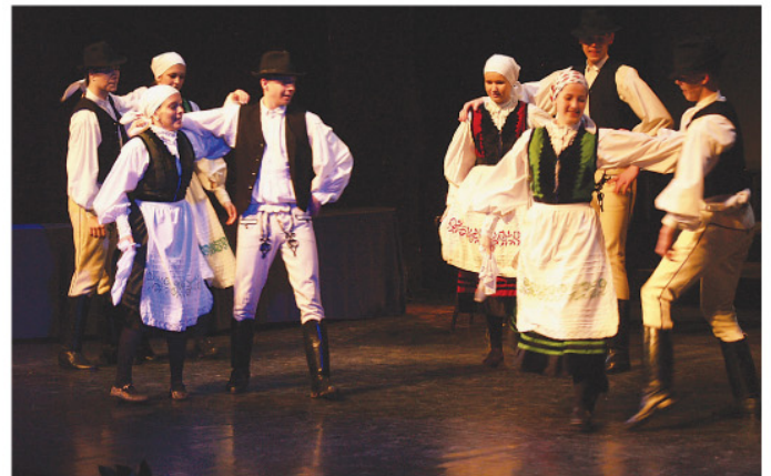
Nagy sikerrel lépett fel az ünnepi műsorban a Kutyakölykök formáció és a Zalai Táncegyüttes.