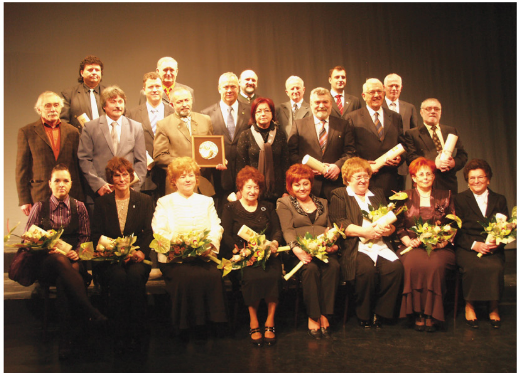
Zala megye kitüntetettjei.

Ezt követően Manninger Jenő magasztos beszédét hallgathatták meg a résztvevők. Felszólalásában hangsúlyozta: a kormányzat megszorításai, a központi elvonások nem szeghették kedvünket, méltóképpen és örömmel ünnepeltük megyénk 1000 éves millenniumát tavaly. A községek és megyei zászlók lobogása, az áradó tömeg, a zalai földből származó együtvé tartozás jelei, a szülőföld szeretete és megbecsülése maradó pillanatokkal, élményekkel gazdagított bennünket a több szempontból is szakrális helyen, Zalaváron . Majd így folytatta: Deák Ferenc és társai a kiegyezésért küzdöttek az 1860-as években. Az Első fel-