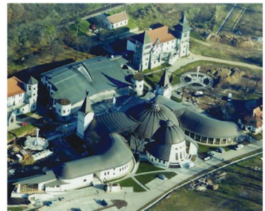
A Pázmány Péter Egyetem.

Építésze emberközpontú, humanizált, „látó” házainak szemük van (két ablak vagy ajtó), amivel a „belső lényegét” kívánja kifejezni, azt, hogy az épület lény. Alkotásai magyar és nemzetközi építészeti vonatko-