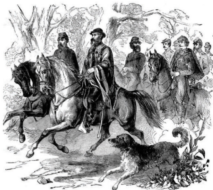
Asbóth és vezérkara a Pea Ridge-i csata előtt.