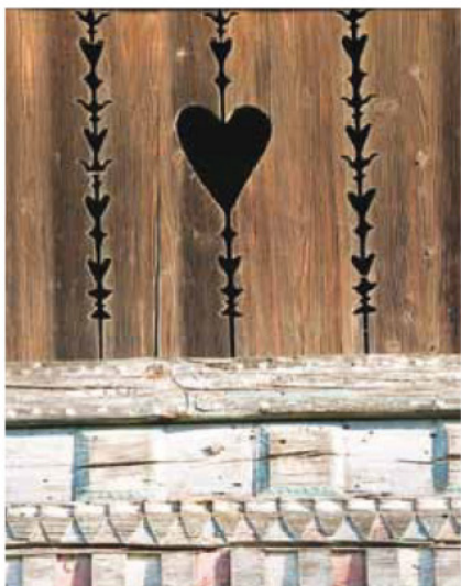
Fűrészelt, festett oromdeszkázat részlete (Göcseji Falumúzeum)

A megyeszerte általános, „egyvégtében”, egyenes tetőgerinccel épült házakhoz képest a göcseji boronáépületek formagazdagsága nagyobb. A természet adta lehetőségek és a gazdálkodás különbözősége a zárt falusi utcák helyett kisebb épülecsoportokból álló falurészeket, úgynevezett szegeket hozott létre, amelyeket legtöbbször az ott lakó családról neveztek el (Barabásszeg, Pálfiszeg, Kustánszeg, stb.). E szegekben többféle ház- és