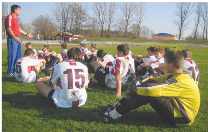
Mérkőzés utáni értékelés.